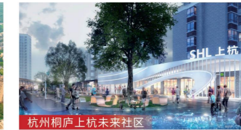
杭州桐庐上杭未来社区