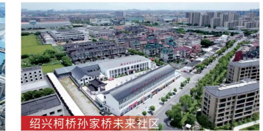
绍兴柯桥孙家桥未来社区