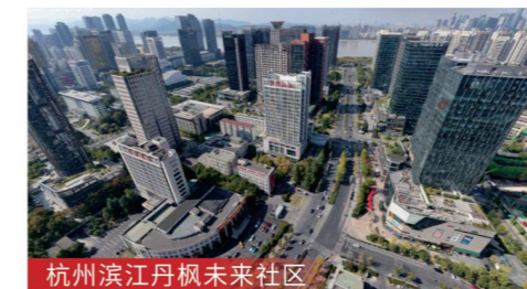
杭州滨江丹枫未来社区