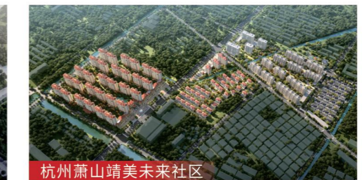
杭州萧山靖美未来社区