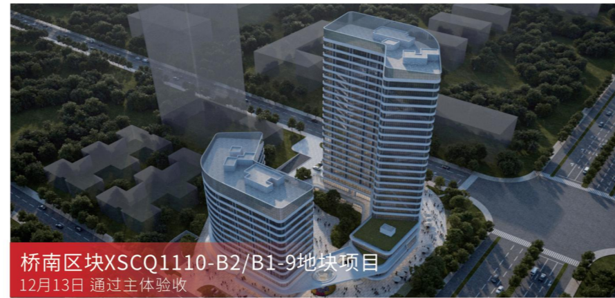
桥南区块XSCQ1110-B2/B1-9地块项目 12月13日 通过主体验收

服务模式 全过程工程咨询 项目规模 总建筑面积约7.8万平方米, 总资产约3.1亿元