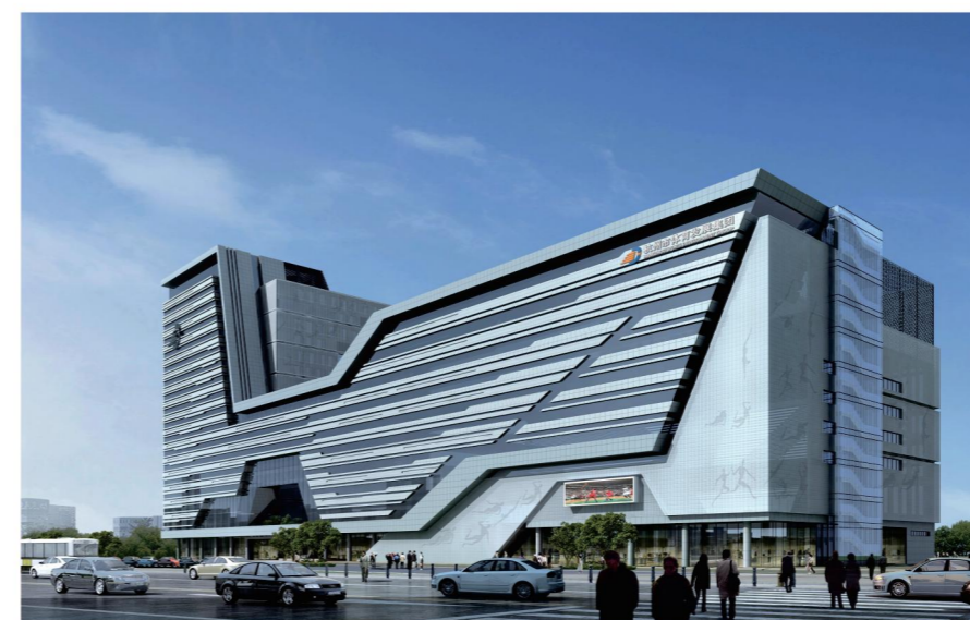
杭州市全民健身中心

近日，由中国建筑业协会组织开展的“2022-2023年度第二批中国建设工程鲁班奖(国家优质工程)”入选名单揭晓。2022-2023年度，五洲工程顾问集团共获4项鲁班奖，以专业与匠心打造一个高品质作品，筑就一座座荣誉丰碑。