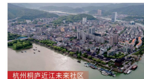
杭州桐庐近江未来社区