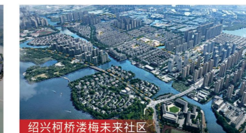
绍兴柯桥澄梅未来社区