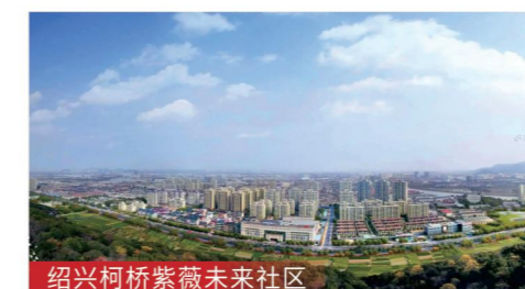
绍兴柯桥紫薇未来社区