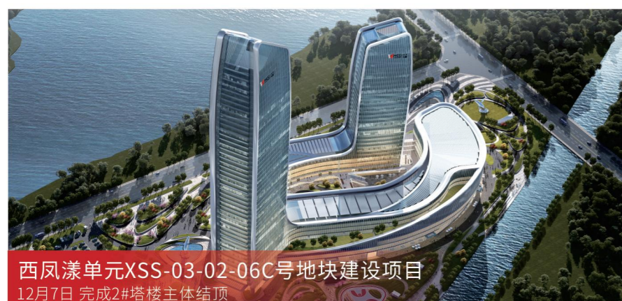
西凤漾单元XSS-03-02-06C号地块建设项目 12月7日 完成2#塔楼主体结构

服务模式 工程监理 项目规模 总建筑面积约18.6万平方米, 总投资约13.7亿元