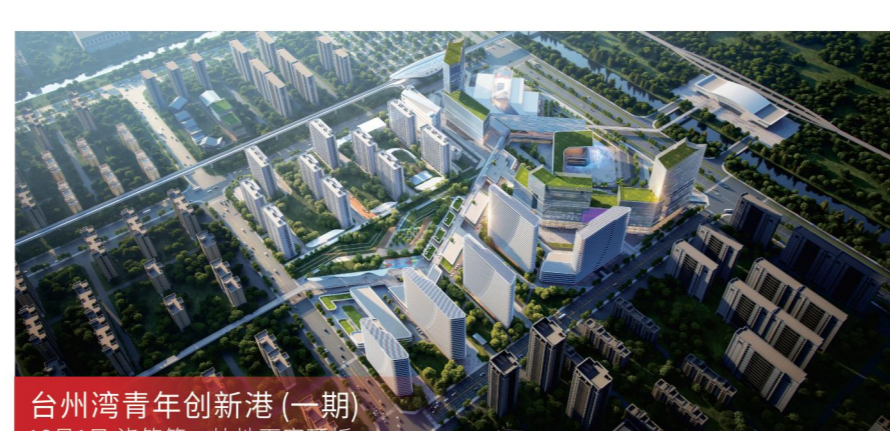
台州湾青年创新港(一期) 12月1日 浇筑第一块地下室顶板

服务模式 工程监理 项目规模 总建筑面积约18.6万平方米, 总投资约13.7亿元