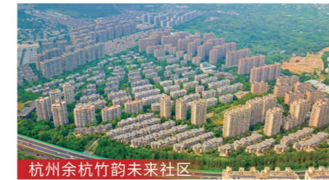
杭州余杭竹韵未来社区