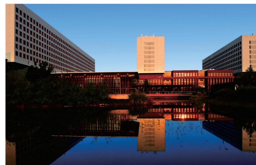
浙江大学医学院附属第一医院余杭院区

总建筑面积约42万平方米，总投资约65亿元，建筑高度190米，地下4层，地上由商务主楼、副楼和培训楼3幢塔楼及裙房组成，是集商业、金融、办公、培训、客房于一体的公共建筑，是浙江省重点建设项目。项目位于杭州钱江新城CBD核心板块，紧邻杭州政商核心建筑群，拥有多维立体便捷交通，与城市相生相融，让城市进出更为高效，是杭州金融中心的标志性建筑。