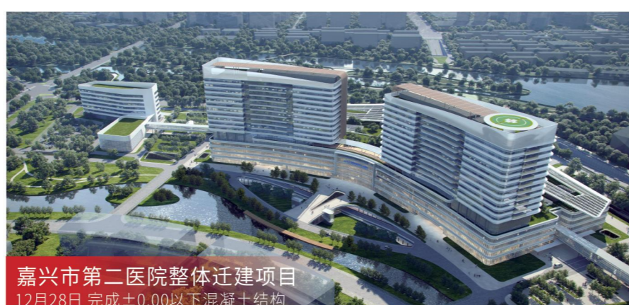
嘉兴市第二医院整体迁建项目 12月28日 完成±0.00以下混凝土结构

服务模式 全过程工程咨询 项目规模 总建筑面积约50.2万平方米, 总投资约46亿元