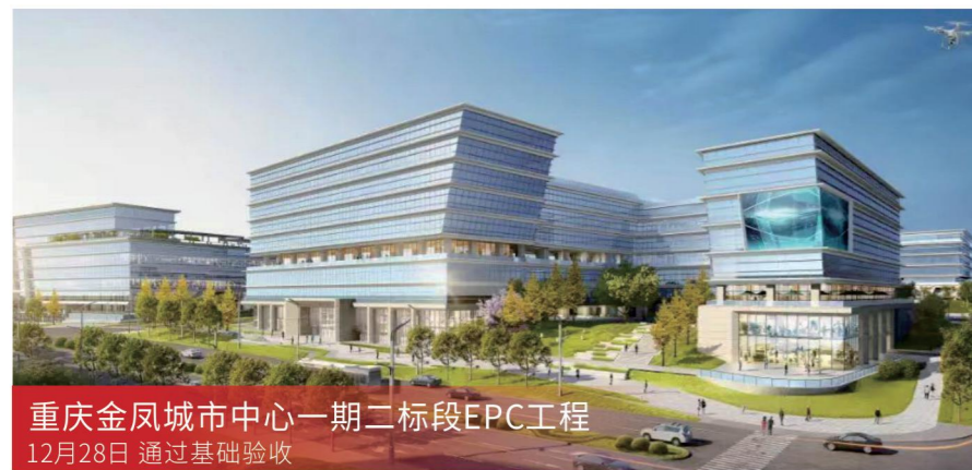
重庆金凤城市中心一期二标段EPC工程 12月28日 通过基础验收