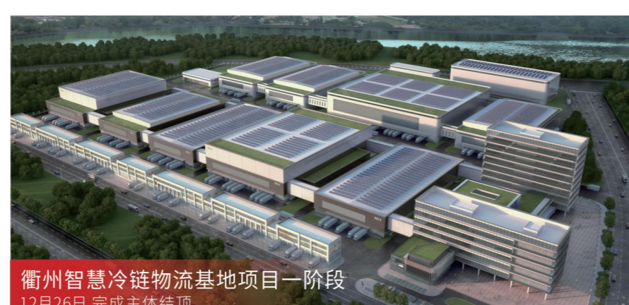
衢州智慧冷链物流基地项目一阶段 12月26日 完成主体封顶