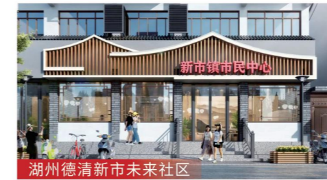
湖州德清新市未来社区