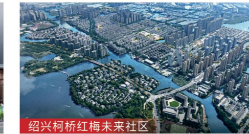
绍兴柯桥红梅未来社区