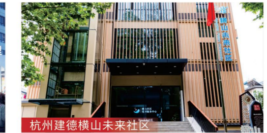
杭州建德横山未来社区