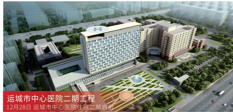
运城市中心医院二期工程 12月28日 运城市中心医院住院二部启用