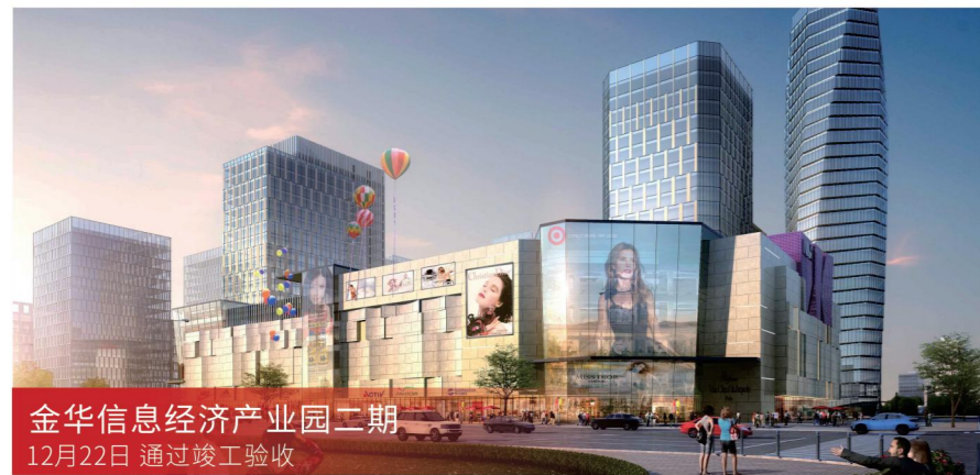
金华信息经济产业园二期 12月22日 通过竣工验收

服务模式 全过程工程咨询 项目规模 总建筑面积约7.8万平方米, 总资产约3.1亿元